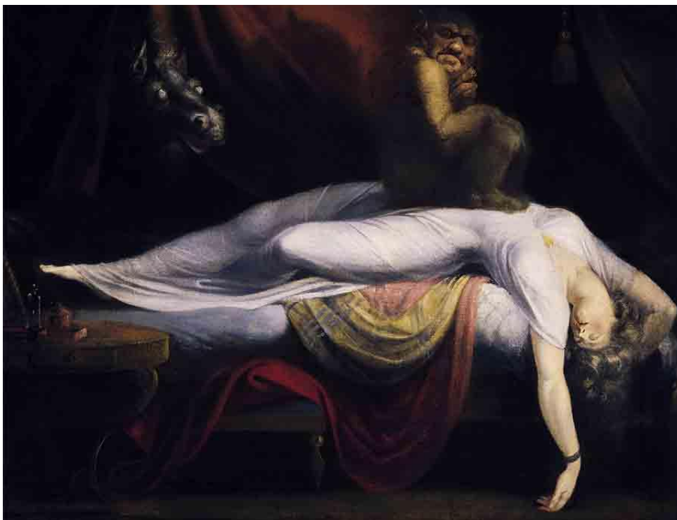
Henry Fuseli , The Nightmare (1781)

Under opplysningstiden og klassisismen på 1700-tallet, altså epoken før romantikken, hadde man satt fornuften veldig høyt. I romantikken er det ikke slik at fornuft er noe dårlig, men mange begynner nå å føle at mennesket er mer enn fornuft. Det som gjør mennesker interessante er at vi har evnen til å komme i kontakt med noe mer enn det som kan oppleves med fornuften og sansene, noe annet, noe som er over oss eller utenfor oss, som vi kan føle i intense, spesielle øyeblikk.