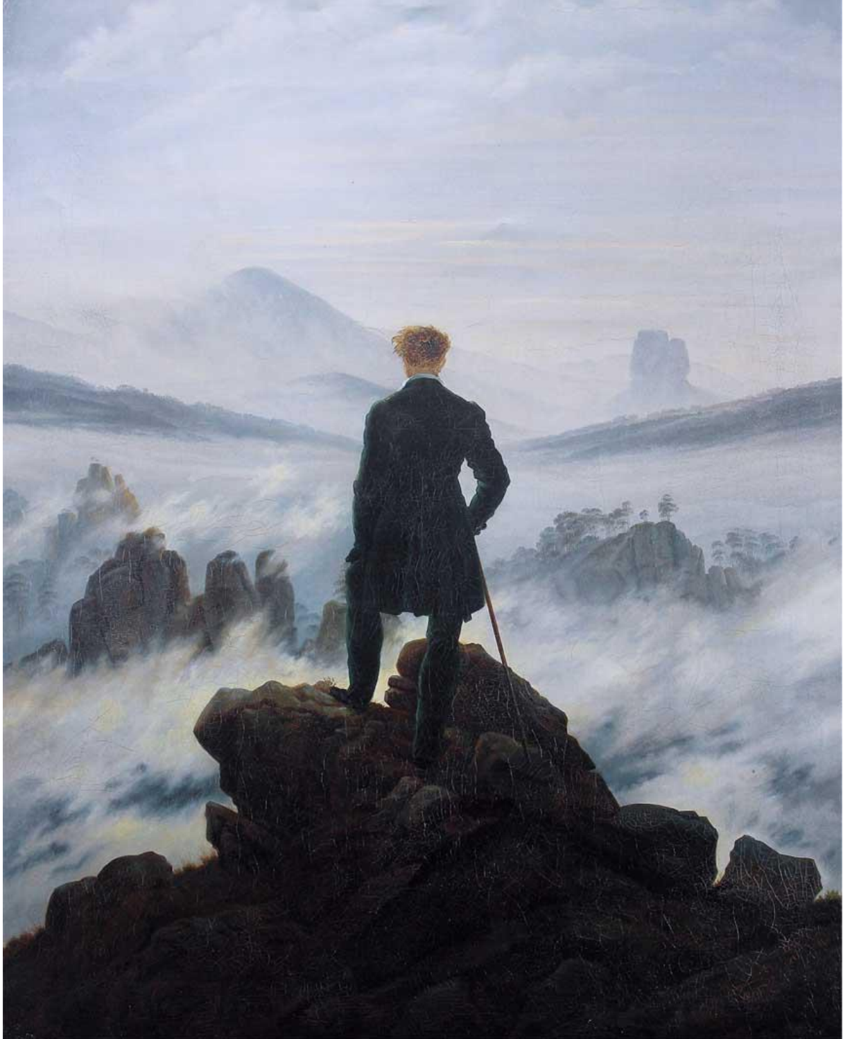
Caspar David Friedrich , Vandrer over tåkehavet (ca. 1818)