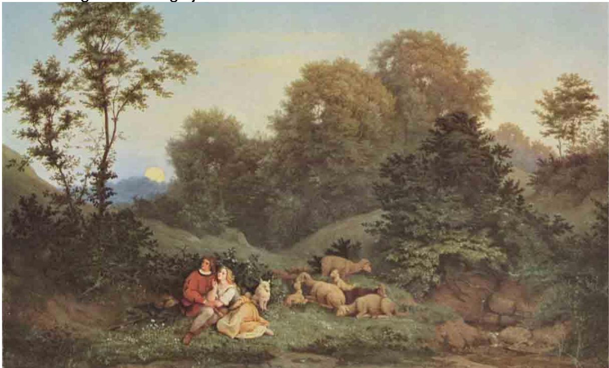
Ludwig Richters, Vårkveld (1844)

Pastoraldiktning, eller hyrdediktning var en annen ting som inspirerte tysk romantikk. Pastoraldiktning var en vanlig sjanger i antikken, altså i det gamle Hellas og Roma. I denne diktningen spilte idyllisk og vakker natur en viktig rolle. Ofte befinner det lyriske jeget seg ute på landet, omgitt av rislende bekker, sauer som gresser, og så videre. Ofte lengter man i disse diktene også tilbake til en enda bedre tid, en svunnen gullalder, hvor alt var bedre. Når man blander følelsesaspektet fra den pietistiske inderlighetsdiktningen, og natur- og lengselsaspektet fra pastoraldiktningen, begynner man altså å nærme seg det vi i dag kjenner som romantikk.